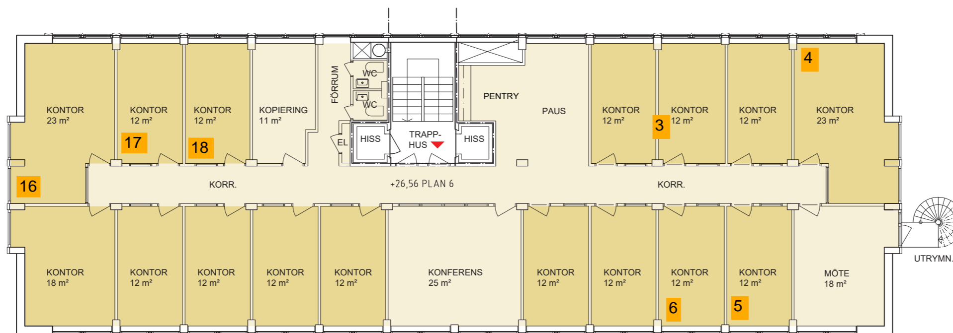
Plan Vån 6 skala 1:150